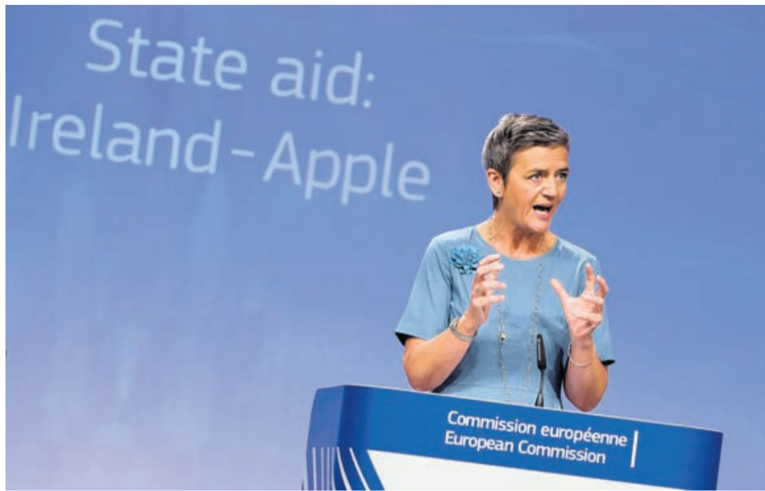
In this Tuesday, Aug. 30, 2016 file photo, European Union Competition Commissioner Margrethe Vestager speaks during a media conference at EU headquarters in Brussels.

The EU Commission had ordered Apple to pay for gross underpayment of tax on profits across the European bloc from 2003 to 2014. The commission said Apple used two shell companies in Ireland to report its Europe-wide profits at effective rates well under 1%. In many cases, multination-